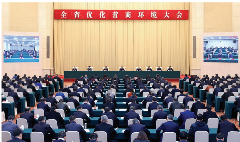
2月18日，全省优化营商环境大会在石家庄召开。

倪岳峰指出，以习近平同志为核心的党中央高度重视优化营商环境，习近平总书记去年视察河北时强调，“下大气力优化营商环境”“要打造市场化、法治化、国际化一流营商环境”，为我们做好工作指明了前进方向。省委、省人民政府牢记习近平总书记殷切嘱托，坚持把优化营商环境作为忠诚捍卫“两个确立”、坚决做到“两个维护”的实际行动，作为推进河北高质量发展的重要举措。各地各部门聚焦重点、协调联动，抓服务、提质效，抓改革、破堵点，抓整治、解