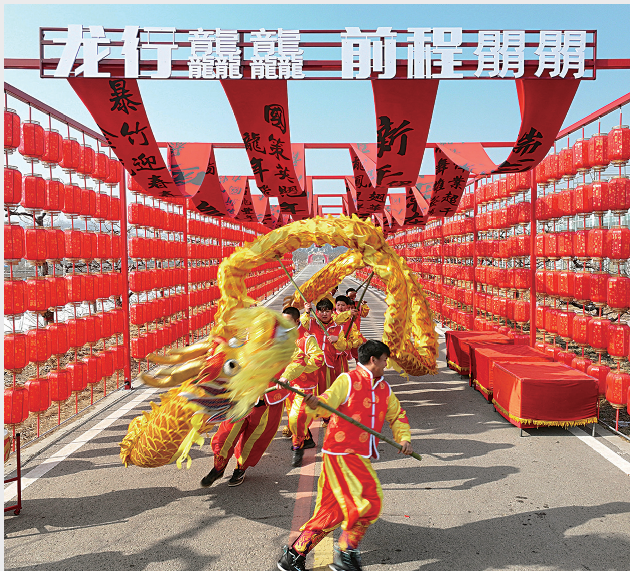
迁西县五海庄园景区的舞龙表演。