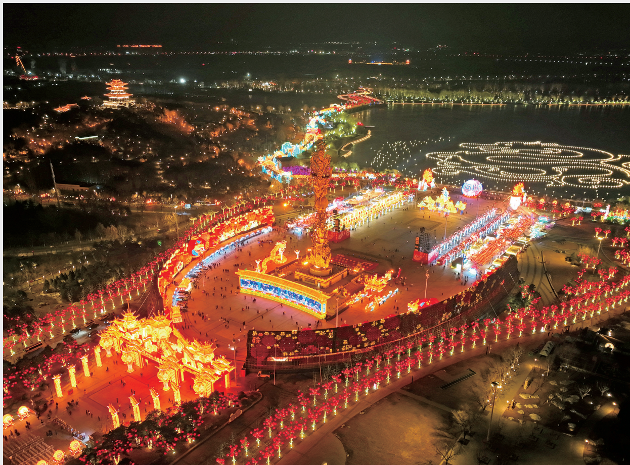
龙年春节，南湖灯会流光溢彩。