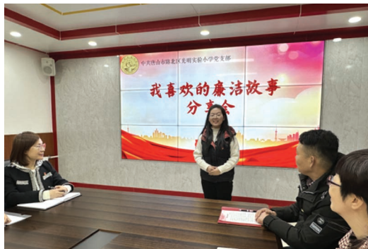
图为光明实验小学组织“我喜欢的廉洁故事”分享会。

前不久，路北区召开领导干部政治性警示教育大会，会上通报了该区纪委监委严肃查处的教育系统严重违纪违法