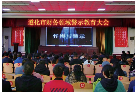
图为遵化市财务领域警示教育大会现场。

摆问题原因。我们坚持选准典型案例，以精细深入剖析促精准深度整改。”该市纪委监委相关负责同志介绍。